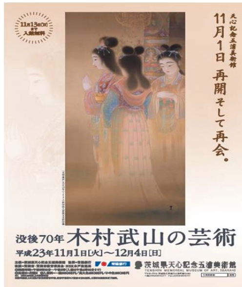
<키타무라 부잔 전시회 팸플릿>