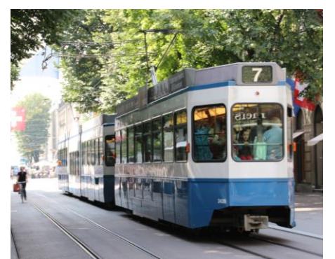
Tram in Zürich