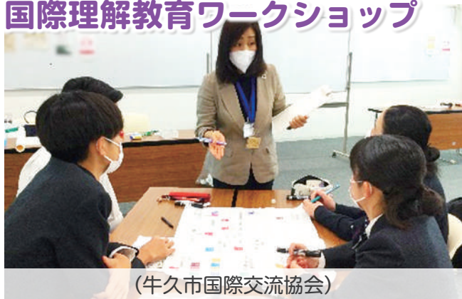
(牛久市国際交流協会)