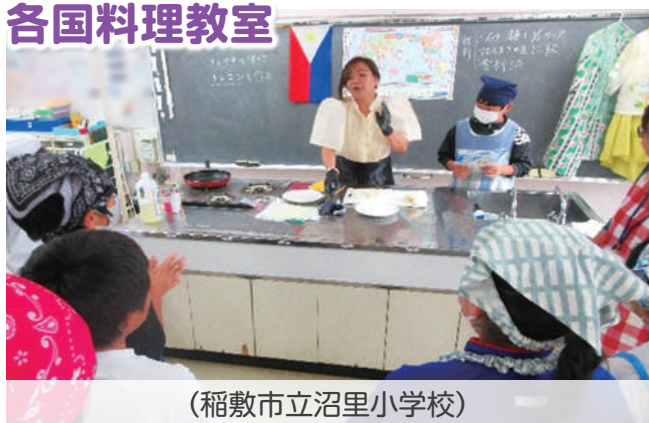
(稲敷市立沼里小学校)