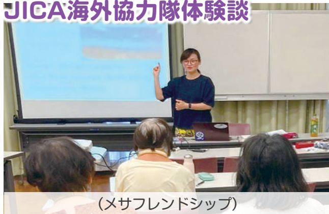
(メサフレンドシップ)