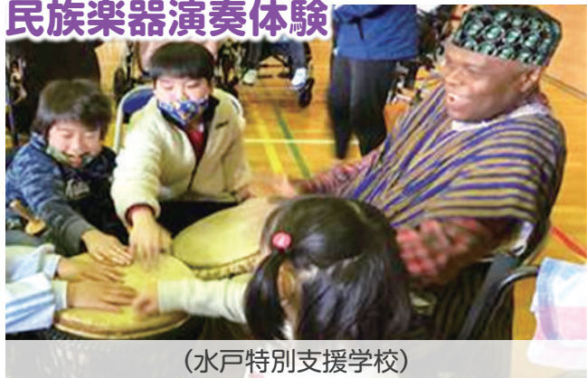
(水戸特別支援学校)