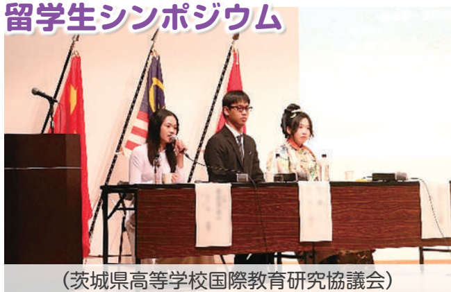
(茨城県高等学校国際教育研究協議会)