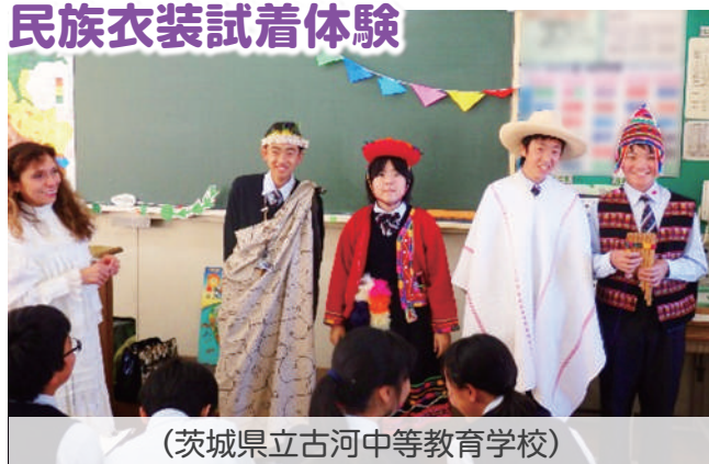
(茨城県立古河中等教育学校)