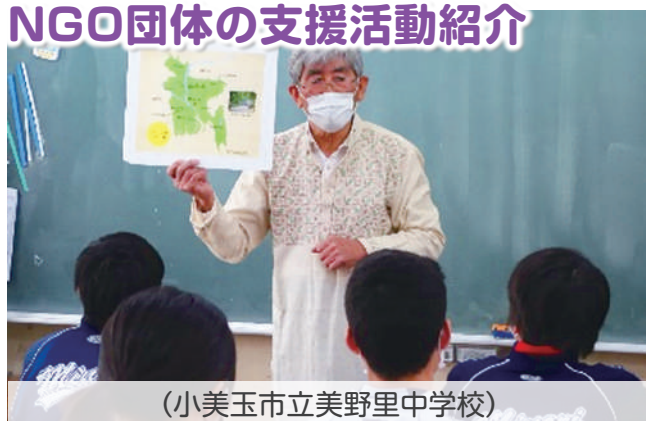
(小美玉市立美野里中学校)

* 活用例の詳細につきましては、背表紙(3)ワールドキャラバン活用の例をご覧ください。